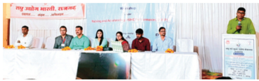
हरिभूमि न्यूज़ ▶▶ सारंगपुर

लघु एवं सूक्ष्म उद्योग मंत्रालय, मध्यप्रदेश एवं उद्योग विभाग राजगढ़ के संयुक्त तत्वाधान में गुरुवार को मांगलिक भवन सारंगपुर में एक दिवसीय कार्यशाला आयोजित की गई। यह कार्यशाला राजिंज एंड एक्सप्लोरिंग एम्प्लोयमेंट परफॉर्मैन्स (टाइड) योजना के अंतर्गत लघु उद्योग भारतीय के सहयोग से संपन्न हुई, जिसका उद्देश्य उद्योगों को उद्योग विस्तार, सरकारी योजनाओं और डिजिटल प्लेटफॉर्म से जोड़ने के फायदों से अवगत कराना था।