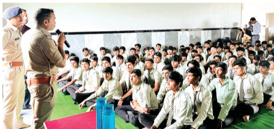
कैसे आगे बढ़ना इस हेतु प्रतिदिन विद्यालय के शिक्षकों द्वारा प्रोजेक्टर के माध्यम से समझाया जा रहा है। इसी कड़ी में शुक्रवार को स्थानीय पुलिस

गुरुकुल कॉन्वेंट स्कूल में बच्चों को मोटिवेट करने के लिए एक नवाचार किया जा रहा है जिसके अंतर्गत प्रतिदिन प्रार्थना सभा में बच्चों को प्रोजेक्टर के माध्यम नई नई सीख प्रदान की जा रही है जिसके अंतर्गत बच्चों को प्रतिदिन का इतिहास समाचार और आर्टिफिशियल इंटेलिजेंसी में करियर कैसे बनाये एवं अन्य प्रकार से मोटिवेट करने हेतु ऑडियो वीडियो के माध्यम से प्रोजेक्टर पर छोटी छोटी फिल्म दिखाकर मोटिवेट किया जा रहा है। जीवन में आने वाली समस्याओं से