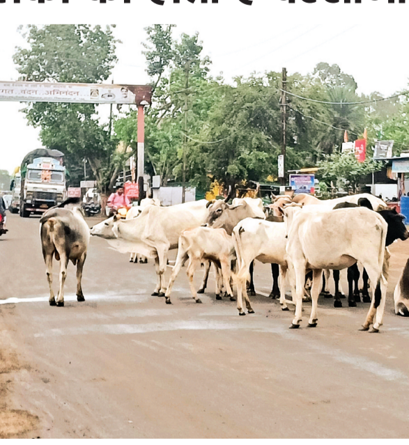
जनपद और नगरी निकाय को जिम्मेदारी सौंप गई थी लेकिन जमीनी हकीकत यह है कि आज भी वे सहाय गाय चौराहों और गलियों में बैठी नजर आती है। प्रदेश भर में गौर संरक्षण के लिए हर पंचायत और हम हर गांव में

शहर से लेकर गांव तक गांव से लेकर सड़कों तक मवेशियों का संकट दिनों दिन गंभीर होता जा रहा है, नगर के मुख्य मार्ग आगर सारंगपुर रोड से लेकर नगर की सड़कों, गलियों और चौराहों पर निराश्रित गोवंश का झुंड देखा जाना आम बात हो गई है जो आमजन के लिए परेशानी का कारण बन गया है। सड़कों पर गोवंश का बैठना और तेज रफ्तार वाहनों के बीच अचानक आ जाने वाले मवेशी न केवल खुद की जान को खतरे में नहीं डाल रहे हैं बल्कि वाहन चालकों के लिए भी बड़ा खतरा बनते जा रहे हैं। सड़कों पर बैठे मवेशी अकसर हादसों की वजह बन जाते हैं स्थिति इतनी भयानक हो चुकी है कि कई बार यह मवेशी राह चलते लोगों पर हमला भी कर देते हैं खास तौर पर बच्चों और बुजुर्ग के लिए और भी खतरनाक हो गया है इसी स्थिति को देखते हुए जिला कलेक्टर द्वारा टीएल बैठक में कलेक्टर द्वारा निर्देश दिए गए थे कि सड़कों पर घूम रही निराश्रित गोवंश को चिन्हित कर गोशाला भेजा जाए, इसके लिए सीएमओ, सीईओ