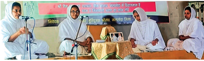
का एकरूप होना जरूरी है। जो हमारे मन हमारे मन की स्थिति सुधर जाए वह मंत्र है। जो मंत्र के जरिये हम धर्म में प्रवेश कर सकते

पुण्य से संसार चलता है, पुरुषार्थ से धर्म चलता है। संसार तो भटकाने वाला है, धर्म तिराने वाला है। इसीलिये मानव जीवन में धर्म करने का पुरुषार्थ करना चाहिये। जिसके मन के अंदर नवकार है संसार में उसका कोई अहित नहीं कर सकता है। नमस्कार महामंत्र में आत्मिक सुख के साथ भौतिक सुख भी देने की अपार शक्ति है। उक्त प्रेरक विचार जैन आराधना भवन में चातुर्मास हेतु विराजित रत्ननिधि म.सा. अपने प्रवचन के दौरान उपस्थित समाज जनों के समक्ष व्यक्त किये। नमस्कार महामंत्र की महिमा बताते हुवे साध्वी ने कहा कि इस महामंत्र के 68 शाश्वत अक्षर रुपी नाव ही मनुष्य को संसार सागर से पार लगा सकती है। यह एक ऐसी नाव है जो कभी भी डूबने वाली नहीं है। ऐसी नाव में बैठोगे तो आपकी मंजिल आपको अवश्य मिल जावेगी।