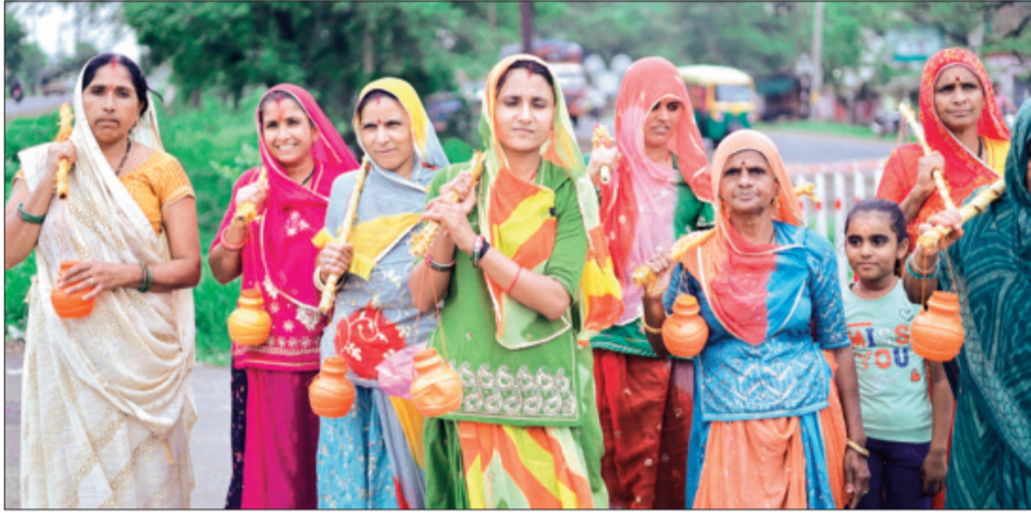
के द्वारा व्यवस्था की जा रही है।