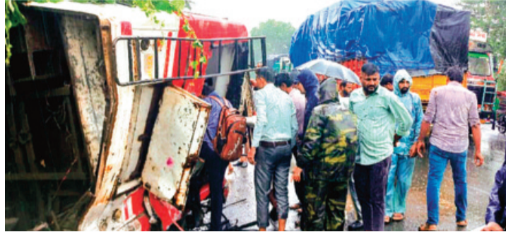
हरिभूमि न्यूज़ ▶▶ राजगढ़-ब्यावरा

घायलों का हालचाल जानने अस्पताल पहुंचे राज्यमंत्री पंवार सहित एसपी, कलेक्टर